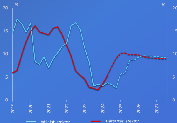
A hitelezés éves növekedési üteme

Megjegyzés: Tranzakció alapú éves növekedési ütem a pénzügyi közvetítőrendszer adatai alapján. Az idősorok a munkáshitel, illetve a Demján Sándor Program hatását nem tartalmazzák.